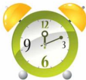
звук часового механизма